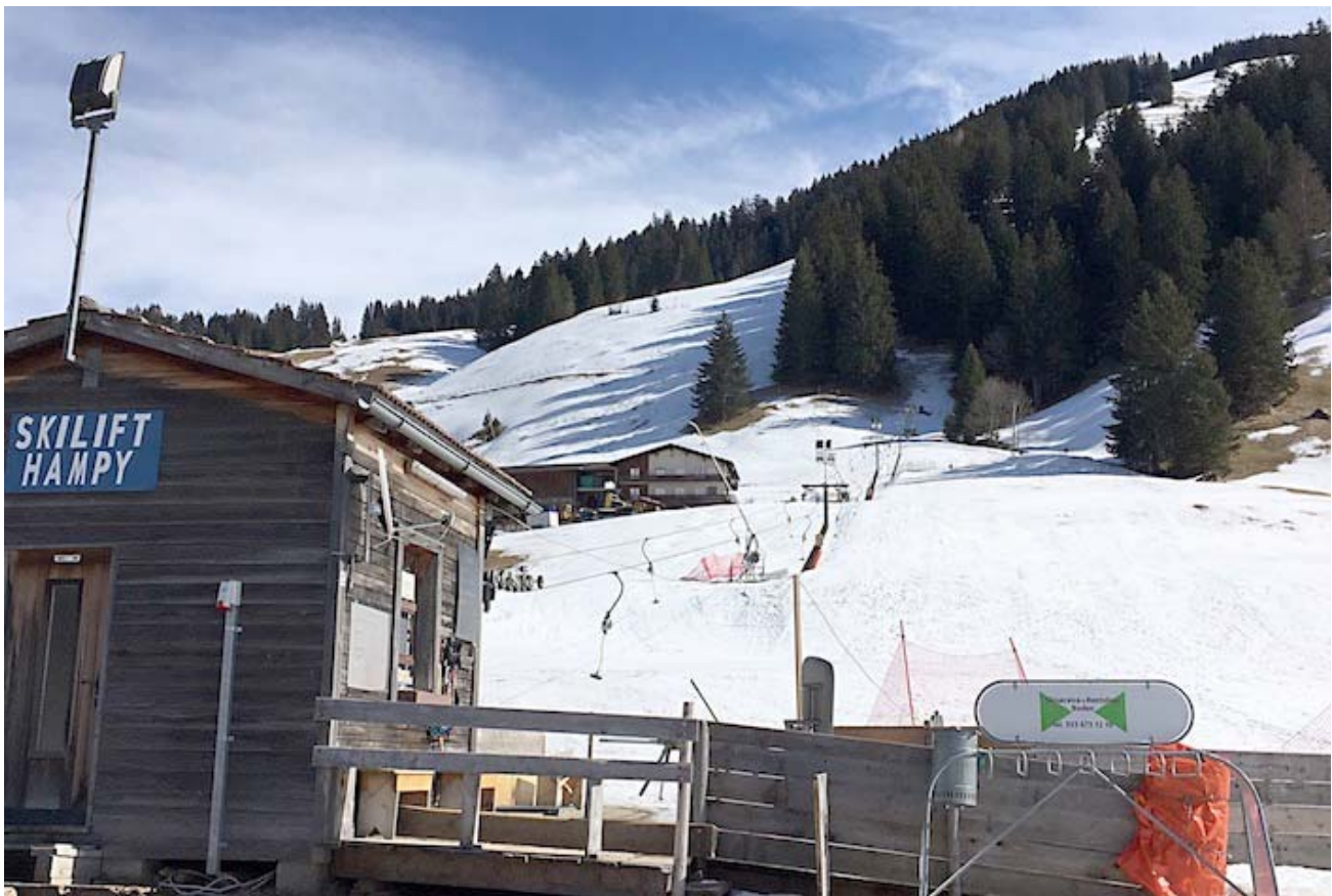
Der Kinderskilift Humpy ersetzt seit bald 20 Jahren den legendären Flecklilift.