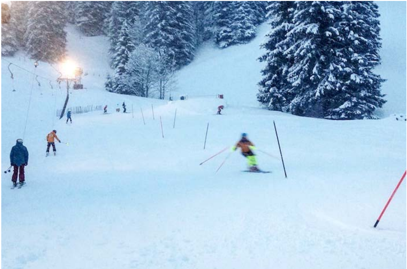
Dienstag und Donnerstag hat der Nachwuchs des RLZ Frutigen ein Nachttraining am Hampylift.